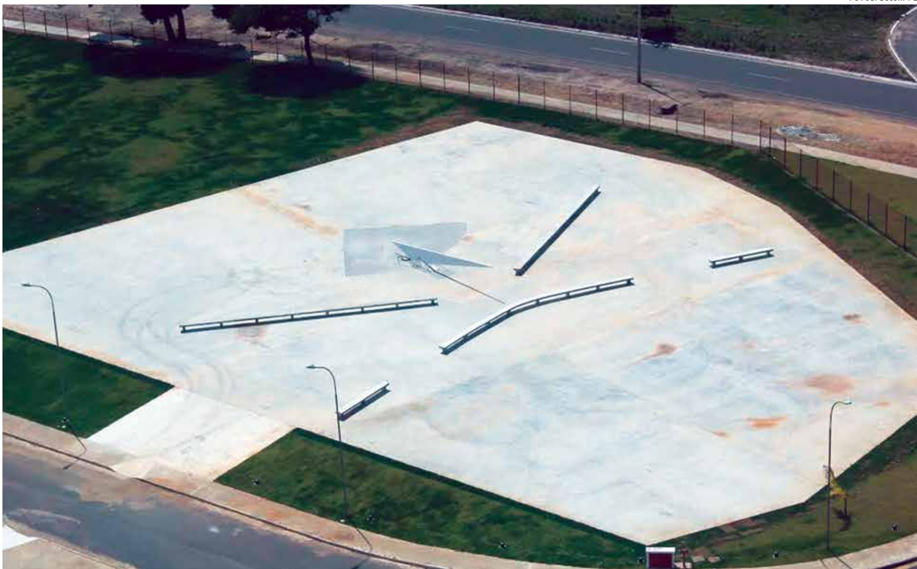
Obra do relógio do sol está sendo concluída e falta ainda terminar a parte do piso e a marcação das linhas com a indicação das horas e dos solstícios de inverno e de verão

A leitura das horas no relógio de sol se dá pela posição da sombra do gnomon no piso, em relação às linhas radiais, que indicam as horas. O desenho foi corrigido para a hora legal em João Pessoa, que é aproximadamente 40 minutos atrasada em relação