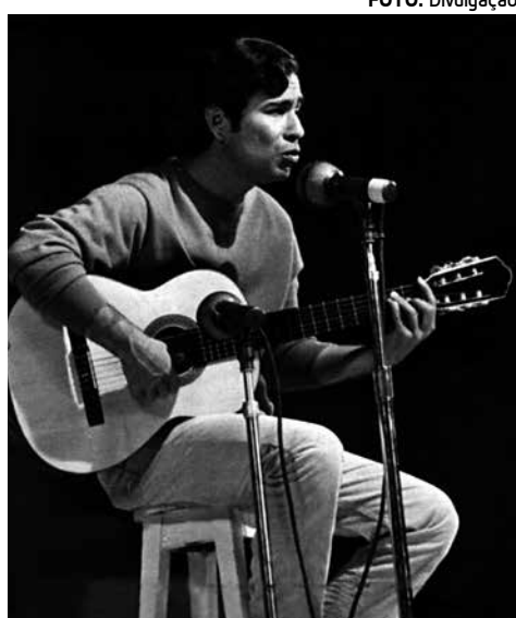
Músico paraibano Geraldo Vandré