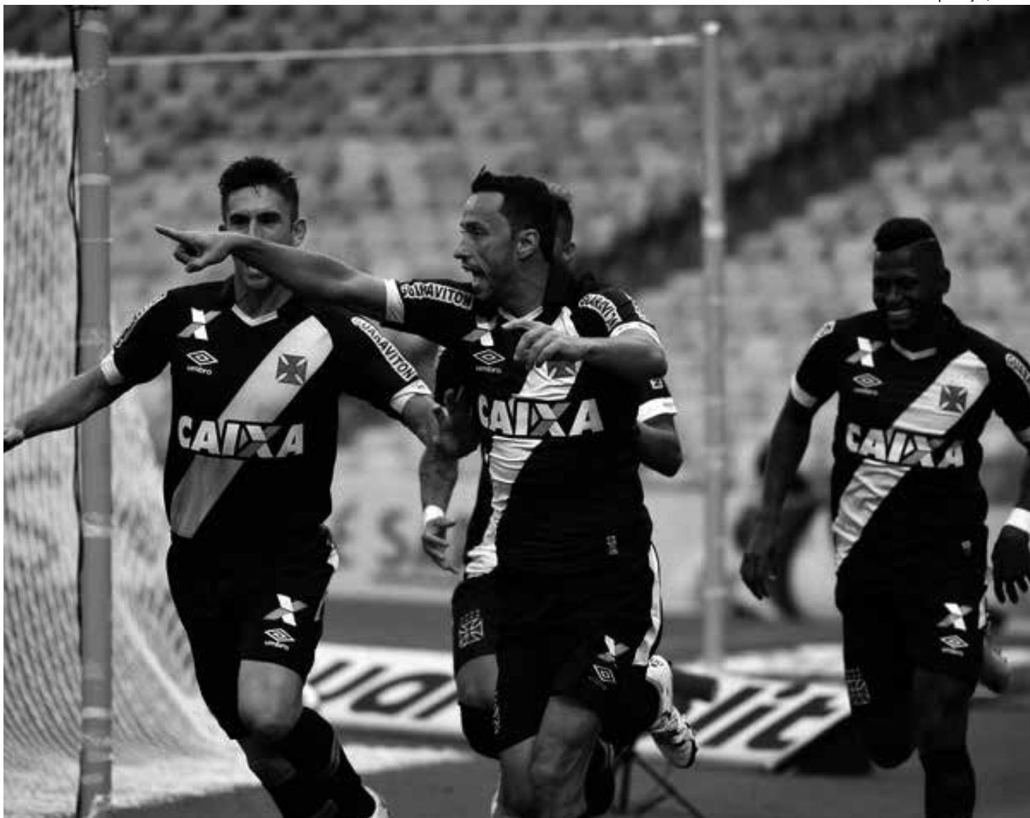
As duas vitórias sobre Ponte Preta e Atlético-PR animaram os jogadores do Vasco da Gama para evitar o rebaixamento à 2ª Divisão

Na outra ponta da tabela, o Vasco conquistou, pela primeira vez no campeonato, a segunda vitória seguida e diminuiu o risco de rebaixamento. Mas nada que deixe a situação do Cruz-Maltino menos desesperadora. A equipe de Jorginho agora, segundo os cálculos de Tristão, tem 96% de risco de cair. Na última semana o número era de 98%. Apesar do péssimo prognóstico, o Vasco tem a campanha do Fluminense em 2009 como alento. Naquela edição, o Tricolor tinha um ponto a menos que o Gigante da Colina na 25ª rodada, era o lanterna e conseguiu escapar da de-