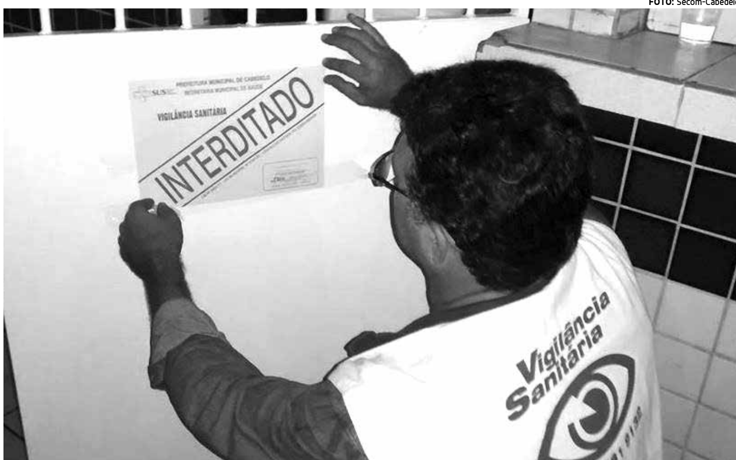
Funcionário da Vigilância Sanitária lacrou um quiosque da casa de shows que ainda foi multada pelo Procon de Cabedelo

A casa terá 10 dias para apresentar sua defesa diante das irregularidades constatadas. “A operação foi positiva. Iremos voltar e exigir a adequação da casa de shows, sob pena de interdição total”, finaliza Francinaldo.