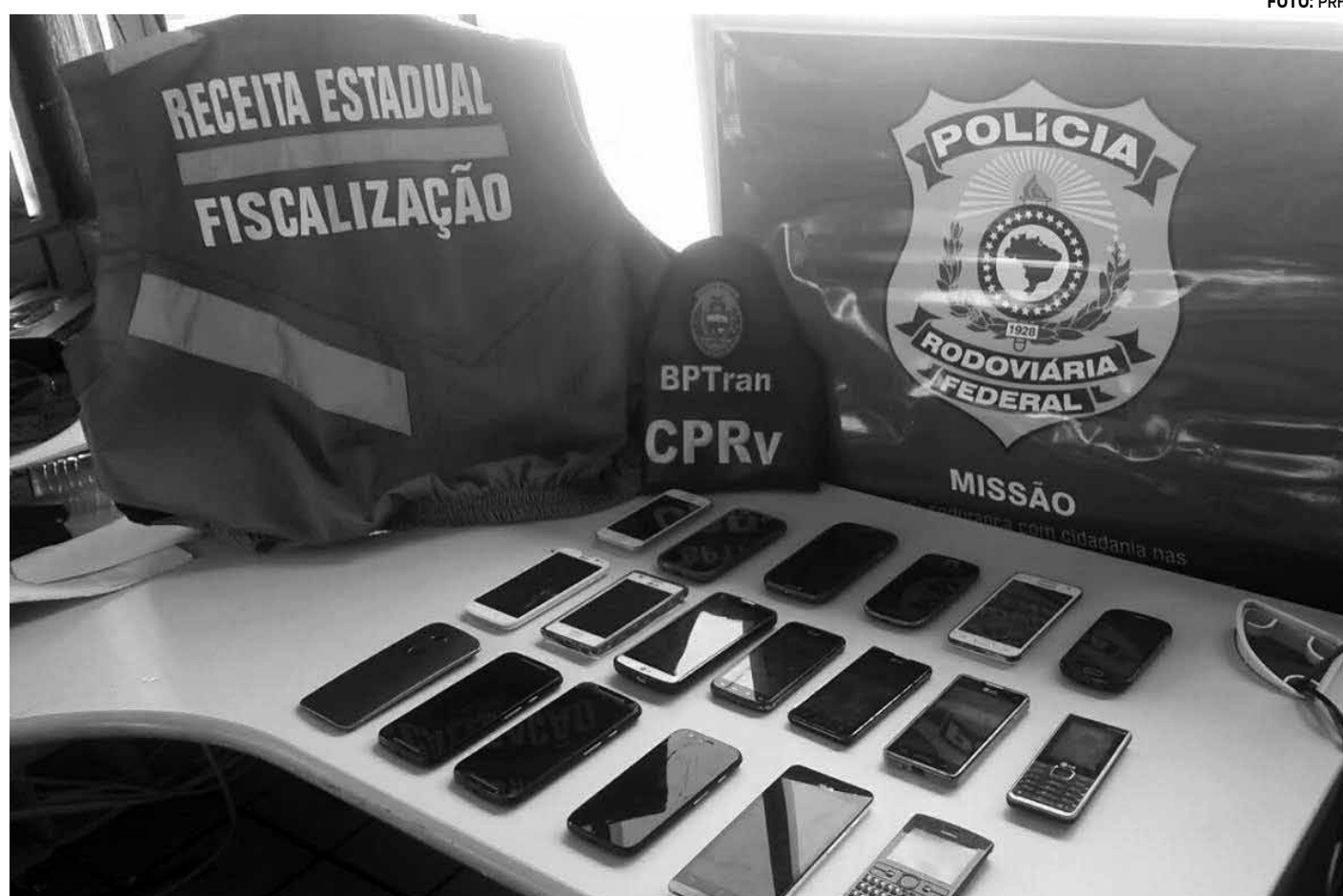
Foram apreendidos 21 aparelhos celulares furtados, maconha e cocaína na ação, que aconteceu na BR-101, em Mamanguape

Acusados foram localizados após denúncias