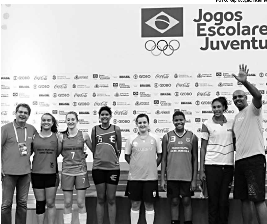
Ao final dos Jogos Escolares da Juventude, em Fortaleza, foram anunciados os melhores atletas

A Seleção Escolar de vôlei é formada por 40 jogadores, sendo 20 rapazes e 20 moças. Além deles, 18 treinadores das escolas participantes dos Jogos também foram convocados. Eles participarão de