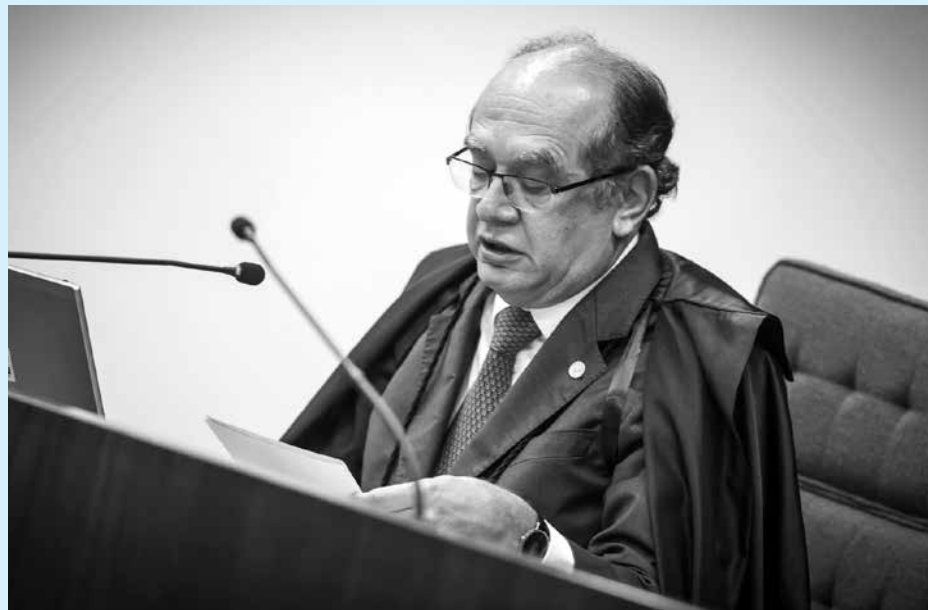
O ministro Gilmar Mendes disse que não há como impor mais sacrifícios à sociedade