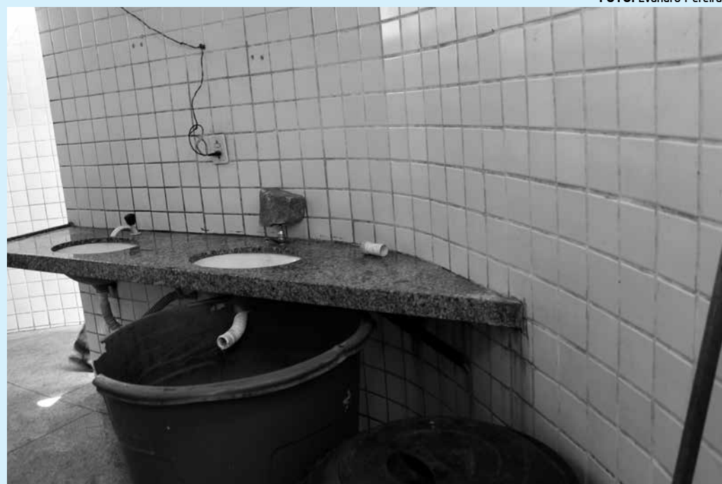
Este banheiro de um dos mercados públicos retrata bem como são conservados esses locais