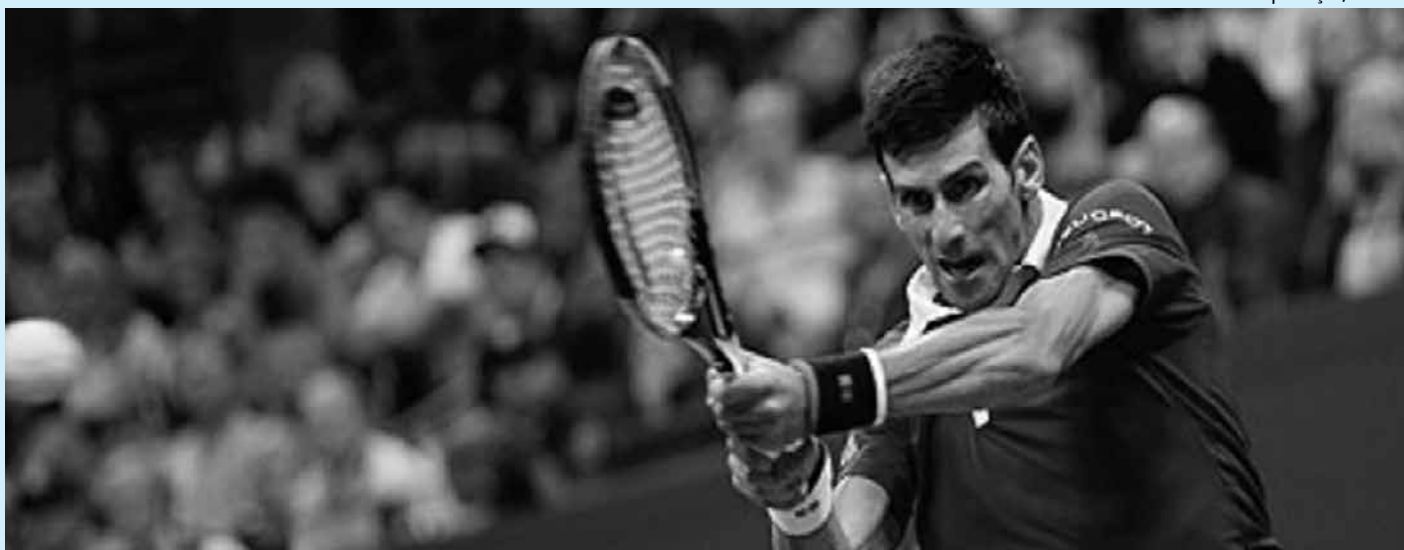
Sérvio até se machucou durante o jogo, mas nada impediu de derrotar o suíço Roger Federer na final do Aberto dos EUA