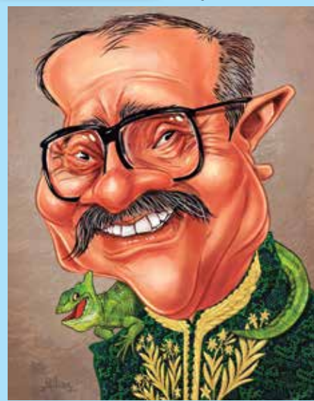
ILUSTRAÇÃO: William Medeiros